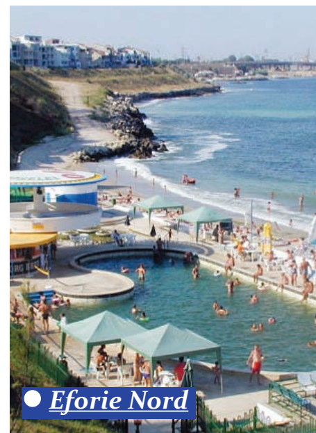
● Eforie Nord

Proiect selectat în cadrul Programului Operațional Regional și cofinanțat de Uniunea Europeană prin Fondul European pentru Dezvoltare Regională.