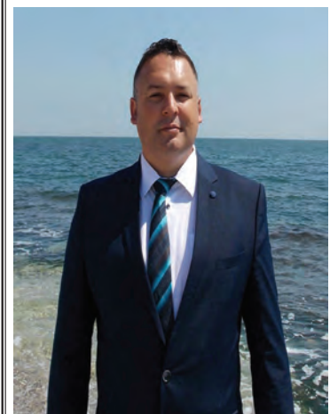
Jeanu Dumitru primarul Comunei Costinești