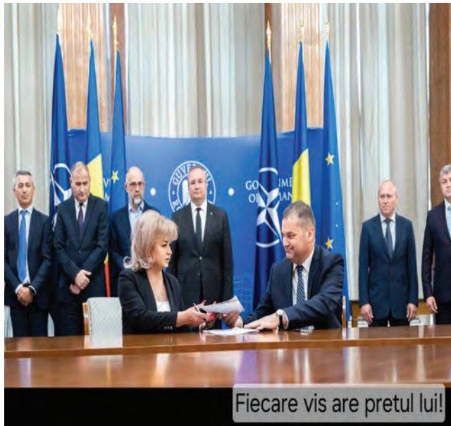
Fiecare vis are pretul lui!