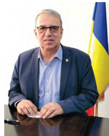
Vergil CHIȚAC, primarul Municipiului CONSTANȚA

Cel mai ambițios scenariu – D – ar transforma zona Anghel Saligny într-un hub regional de inovație și producție, atrăgând peste 90.000 de locuri de muncă și capital privat semnificativ, în timp ce scenariile C și B propun dezvoltări sustenabile și echilibrate, cu efecte economice și sociale pozitive. Scenariul A, fără investiții noi, reprezintă o pierdere de oportunitate pentru oraș. Toate scenariile sunt analizate în conformitate cu standardele Cadrului de Mediu și Social al Băncii Mondiale (ESF).