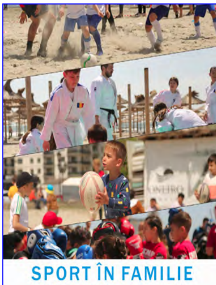
SPORT ÎN FAMILIE