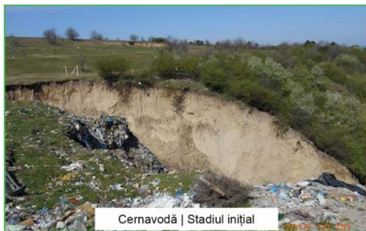
Cernavodă | Stadiul inițial