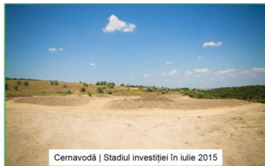
Cernavodă | Stadiul investiției în iulie 2015