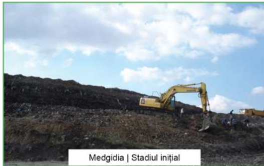
Medgidia | Stadiul inițial