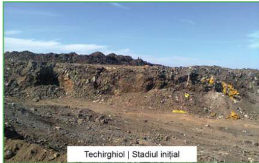
Techirghiol | Stadiul inițial