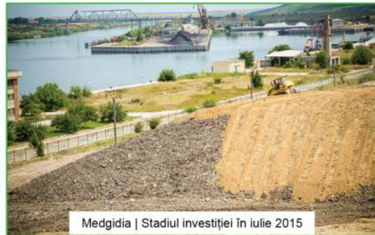
Medgidia | Stadiul investiției în iulie 2015