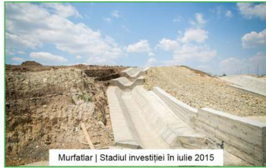
Murfatlar | Stadiul investiției în iulie 2015