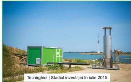
Techirghiol | Stadiul investiției în iulie 2015