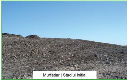
Murfatlar | Stadiul inițial