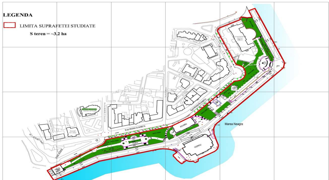
INCADRARE IN ZONA sc. 1:2000