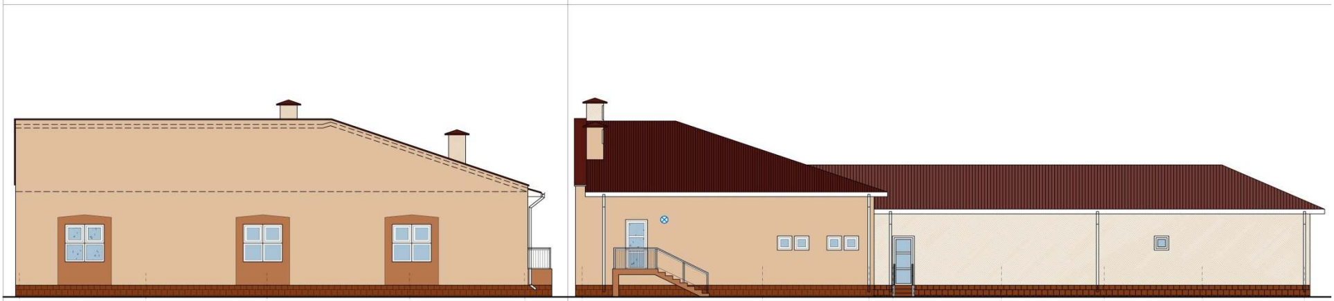
FATADA NORD - PROPUNERE