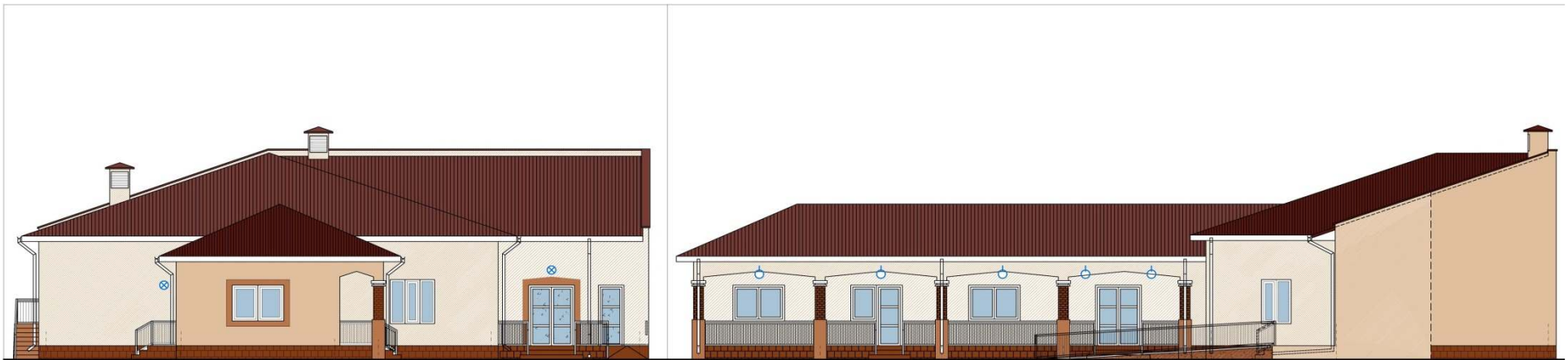
FATADA EST - PROPUNERE