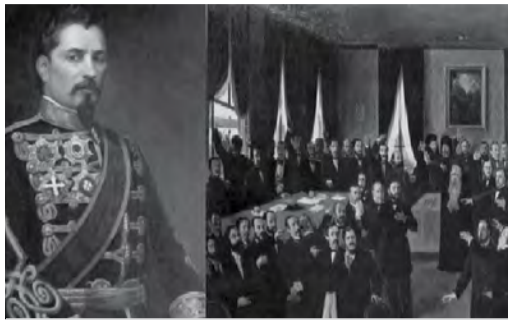
A.I. Cuza și Adunarea Electivă a Țării Românești

Hotărârile luate la Paris în 1856 i-au încurajat pe